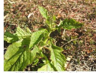
KORAIHAR: Used for Stomachache

koraihar Noun. a kind of medicinal plant; औषधीय पौधा. Category: Medicinal plants.