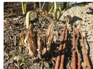
TORTARKUNG: Used for ear problem

tortarkung Noun. a kind of medicinal plant; एक प्रकार का औषधीय पौधा. Category: Medicinal plants.