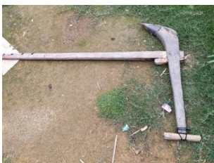
LANGKOL (An indigenous ploughing tool)

langkol 2 Noun. plough; हल. Category: Plow a field.