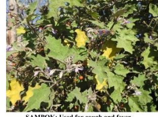
SAMPOK: Used for cough and fever