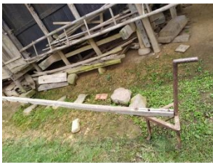
LANGKOL (An indigenous ploughing tool)

langkol 1 [lan̩kol] Noun. plough; सप्तऋषि, हल. Category: Plow a field.