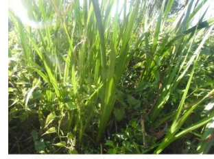
WOKLAI: Used for dry cough

woklai Noun. a kind of medicinal plant; एक प्रकार का औषधीय पौधा. Category: Medicinal plants.