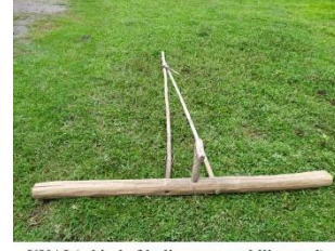
UKAI (a kind of indigenous pudding tool)