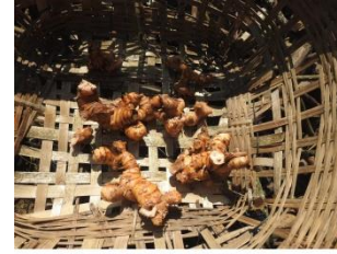
AIMARAI: Used for cold cough

aimarai [aimarai] Noun. A Kind of medicine plant; औषधीय पौधा. Category: medicine.