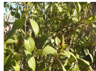
CIKPA: Used for recovery cough and fever

cikpa [cikpa] Noun. a kind of medicinal plant; औषधीय पौधा. Category: Medicinal plants.