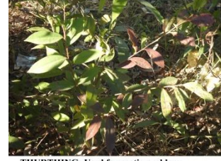
THURTHING: Used for gastic problem

thurthing Noun. a kind of medicinal plant; एक प्रकार का औषधीय पौधा. Category: Medicinal plants.